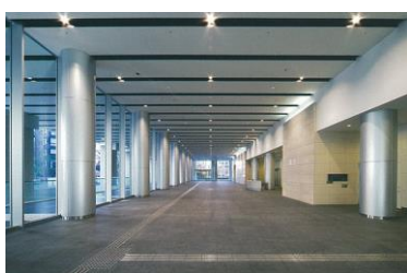
エントランスホール（業務棟）