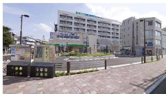
従後写真（駅前広場）