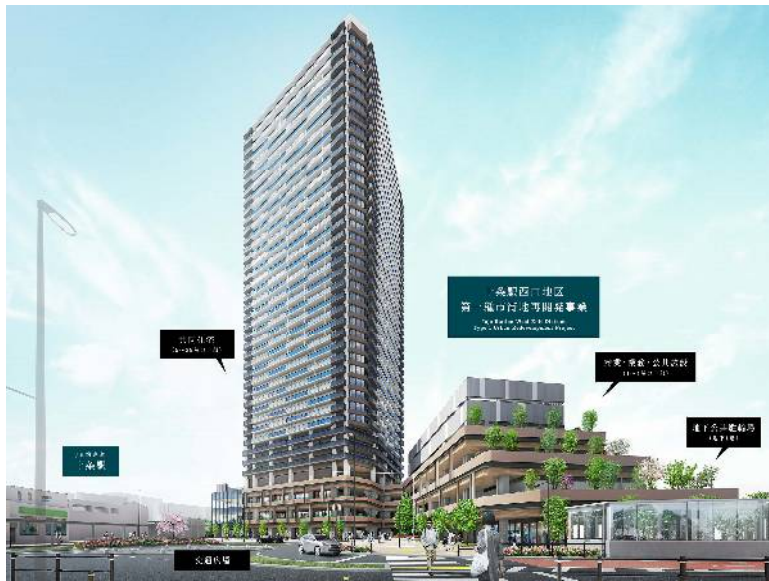
【再開発事業完成予想CG】

新たな賑わい拠点の形成を目指した十条駅西口をご覧いただきたく、本視察会へ是非ご参加頂けますようご案内申し上げます。